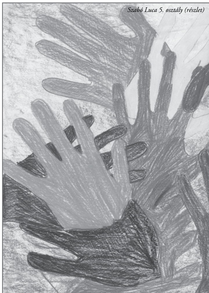
Szabó Luca 5. osztály (részlet)